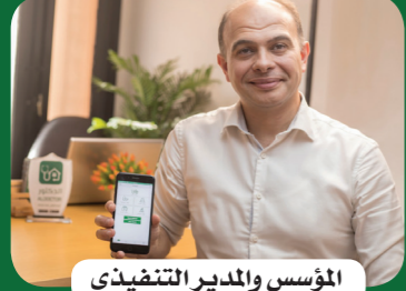
المؤسس والمدير التنفيذي

كما يمكنكم التواصل مع خدمة العملاء أيضا من خلال رقم الموبايل 01003125053