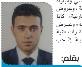
بقلم: محمد الجندي

أوقد اللواء الدكتور / محمد عبد الفضيل شوشة، محافظ شمال سيناء، شعلة تصفيات أوليمبياد المحافظات الحدودية، التي تشارك فيها المحافظة في نسختها الثالثة بالاشتراك مع محافظات، أسوان – الوادى الجديد- جنوب سيناء- البحر الأحمر – مرسى مطروح، وذلك في الصالة المغطاة بالعريش. كما أكد المحافظ على إهتمام الرئيس عبد الفتاح السيسي، رئيس الجمهورية، بتثية طلبة شبابها، مطالباً الفرق الصاعدة للتصفيات بالحصول على مراكز متقدمة على مستوى المحافظات، ومشيراً إلى أن محافظة شمال سيناء متميزة في الألعاب الفردية. وقد أكد كليب راشد مدير عام مديرية الشباب والرياضة، أنه سيتم تنفيذ فعاليات المرحلة التمهيدية داخل المحافظة اعتباراً من اليوم وحتى يوم ٢٠ فبراير المقبل داخل المحافظة، بمشاركة ٢٥٨٨ لاعب ولاعبة على مستوى المحافظة في ١٣ لعبة جماعية وفردية ، والتي سوف يتم