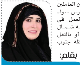
بقلم: مريم هليل

في البداية قبل التقويم الجريجورى في المناطق التي تخضع لنفوذ الكنيسة الكاثوليكية وظلت العديد من الكنائس البروتستانتية والأرثوذكسية على تقويم يولياني القديم لكن مع الوقت تم تعميم التقويم الجريجورى على باقي دول العالم فتحته السويد والندمارك عام ١٧٠٠ وبريطانيا في عام ١٧٥٢ وظل التقويم الجريجورى غير مقبول في المسيحية الشرقية لعدة مئات من السنين وتأسس التقويم الجريجورى في روسيا من قبل الشيوعيين في عام ١٩١٧ وكان آخر بلد أرثوذكسى شرقي لقبول الجدول الزمني اليوناني في عام ١٩٢٤. ولكن لم يعمل بهذا التعديل في مصر إلا بعد دخول الإنجليز إليها في القرن التاسع عشر فتم حذف ١٣ يوماً بدلاً من ١٠ لأن الفرق زاد بين وقت تنبى التقويم ومجمع نيقية وأصبح يوم ٢٥ ديسمبر ليوافق يوم ٢٩ كيهك واستمرت الكنيسة الأرثوذكسية المصرية تحتفل يوم ٢٩ كيهك الموافق حالياً يوم ٧ يناير (بعد حذف ١٢ يوم) أما الكنيسة الكاثوليكية استمرت في الاحتفال يوم ٢٥ ديسمبر. ولهذا السبب تحتفل اليوم الطائفة الكاثوليكية في مصر والعالم بعيد الميلاد يوم ٢٥ ديسمبر فيما تنتظر الكنيسة القبطية الأرثوذكسية (أغلبية المسيحيين في مصر) حتى يوم ٧ يناير لإحتفال بعيد ميلاد المسيح كما تحتفل الطائفة الأنجليكانية في مصر بعيد الميلاد في شهر يناير أيضاً .