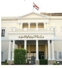
وزارة التربية والتعليم

كشفت مصادر مسئولة بوزارة التربية والتعليم والتعليم الفني، أنه تم تحديد التخصصات المطلوبة لمعلمة بمسابقة الـ ٣٠ ألف معلم، مشيرة إلى أن الأولوية لعمل الصفوف الأولى وضوابط النظم الجديد للتعليم لأنها تعاني من عجز كبير، مضيفة أنه يتم التواصل مع جهاز التنظيم والإدارة مسددة على أنه سيتم إعلان تفاصيل المسابقة والتخصصات المطلوبة قريباً.