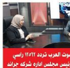
لقاء تلفزيوني على قناة صوت العرب ترويه ١٢/٢١ راسي