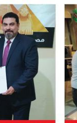
توقيع المبادرة مع شركه مليونير الرعايه الصحيه