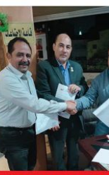
التوقيع عقود مع شركه نظم معلومات و شركه اى