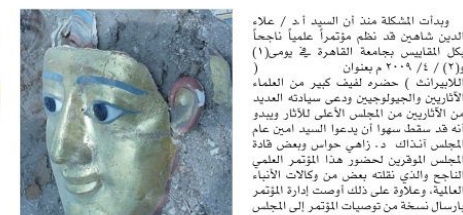
أهم قطعة أثرية عثر عليها بالصلب الشرفى لهرم هوراة وهو آثارى حصى منه

وأوضح للرض من قبل جميع من خلف الأمين العام للمجلس الأعلى للآثار لإنقاذ هرم هوراة راندة حتى ساعة كتايني لهذه السيطرة ولا بعد من ينحو عليه ١- تزي من وجهة نظري المتواضعة بتشكيل لجنة من كبار الأثريين على أعلى مستوى - وبحضورى ويصطفى أول من عمل وشتر في رسالة الماجستير عن هذا الهرم اللبسا كما أستمته - لعامة لتتحاة الهرم المنتم للسياحة الدولية والعلمية وتقييم أعمال المصريين باللذات القومية وتحولت فهد هرم هوراة الكامل للجهات الرقابية المختصة لضرب بيد من حديد وإجراة التسبب في سوء حالته وتمهيد مسوقو لبناته التي على وشك الإهيار الكامل إن لم يسرع الخفى لإنقاذ ٢- العمل على إيجاد الحلول العلمية والعملية بالتعاون مع وزارة اتری لتعبر مسار التركة الشهيرة المناخحة للهرم بضلمه للسياحة المسماة في تسمى ثابرا سلبيا على التنا، كماهله ، أو المسماة في تسمى حيسور هذه التركة (تركة عبد الله وهي) بما يمنع تسرب المياه إلى داخل بطن الهرم اللبسي ٣- استكمال أعمال تقويم المنطقة سياحيا والمرآزر إلى أقره ما قامت الهيئة الأثرية المصرية البولندية هناك من تهيئة الطريق الأثرية إلى المنطقة بالكامل، وبناء دورات مياه تلبق بالوقود والسياحة التي زادت أعدادها أيام العجبة وشهدت ذلك المعاملون للدانوم بالمنطقة، وبالمنطقة، وبالمنطقة، وبالمنطقة ٤- زيادة بقايا النرديم من أمام المدخل ويستمر إصلاح وترميم السلم المؤدي لمدخل الهرم بما يليق بمكانة هذا الهرم التاريخي. ٥- استكمال الأبحاث العلمية وذلك للوقوف إلى مصدر المياة التي تغمر قاعدة الهرم وتصل إلى صدقه وتزيد من تضرر الأعمال الظاهرة