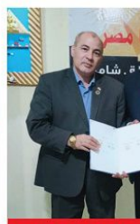
التوقيع مع شركه الملايس الداخليه نيو فيستا لتوريد الملايس الداخليه لمبادره