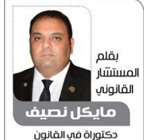
بقلم المستشار القانوني مايكل نصيف