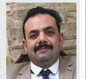
الاهالي كفر حافظ

الحياة رحلة لا تختار بدايتها و نهايتها لكننا علي الاقل يمكن ان نختار مسار تلك الرحلة ان نجعلها بان الله تنتهي نهاية سعيدة و علي الاعمال نحقق خلالها ما يرضي طموحنا والكفاح والعمل المستمر هو الاداة الوحيدة التي يمكنها ان تحول رحلة الحياة الي ثمره حقيقية تستفيد منها الجميع وما احلي ان تكون الرحلة علي طريق