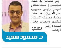
بقلم: د. محمود سعيد