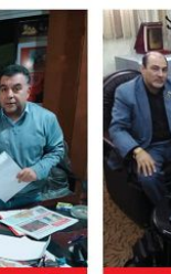
توقيع عقد الشراكة مع عمرافندي