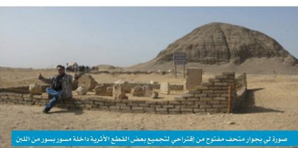
صورة في بجوار منحرف مصنوع من إهتراسيخ للشمع بعض القطع الأثرية داخله مسور بسور من الخان