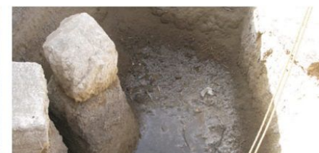
صورة للمصنوع في عميرت أحد المحسات الشاه الحضر بالصلب المصنوع لهرم هوراة